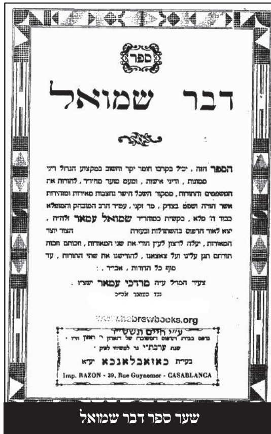
שער ספר דבר שמואל