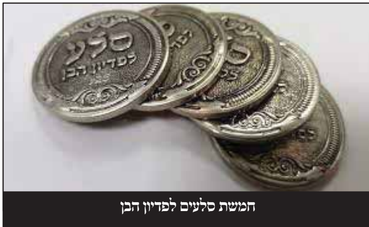
חמשת סלעים לפדיון הבן

התכוין לר"מ מרימנוב זי"ע אלא להרה"ק רבי מרדכי מנעשכין זי"ע, דהרי בספר אילנא דחיי שהוא הספר שמלקט את כל דברי הרבי רבי מנחם מנדל מרימנוב זי"ע, מ"מ הוא מביא להדיא שם דבר זה